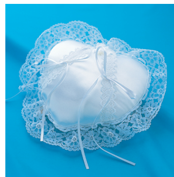
<ハート型「リングピロー」>