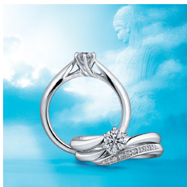
<新作セットリング「アクアニーナ」>