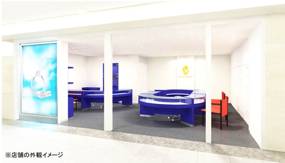
※店舗の外観イメージ