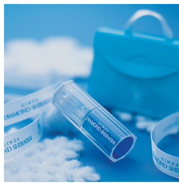
<オリジナル「ダイヤモンドスコープ」>