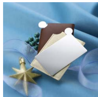
<カード式ミラー（2枚組）>