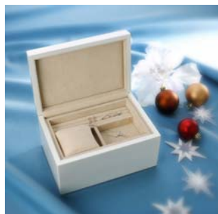
<木製ジュエリーボックス>