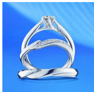
<新作セットリング「アクアニーナ」>