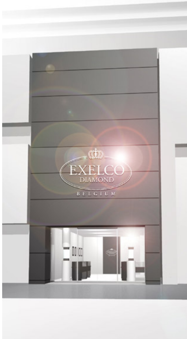
※店舗の外観イメージ