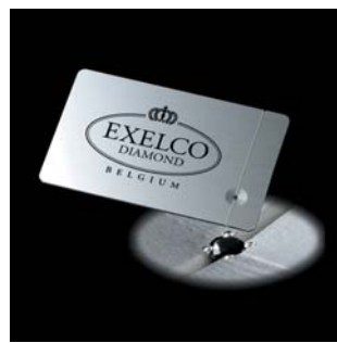
<ブラックダイヤモンドプレート>