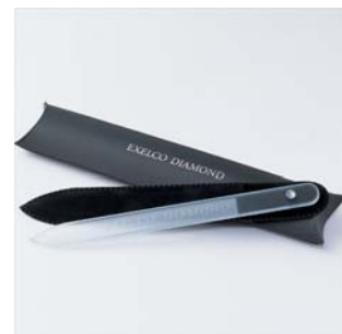
<ネイルファイル(爪やすり)>