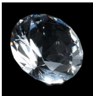
<ダイヤモンドオブジェ>