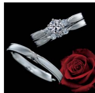
<エンゲージリング・マリッジリング>