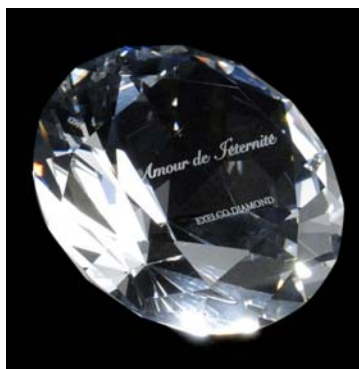
<ダイヤモンド オブジェ>