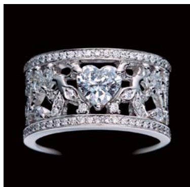
<ダイヤモンド・エンゲージリング>