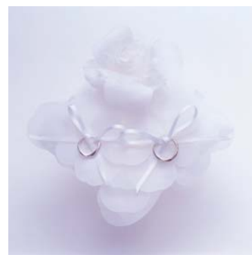
<ローズリングクッション>