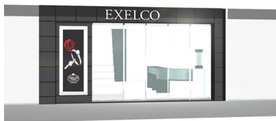
※ブランドカラーが全面を覆うインパクトのあるファサード