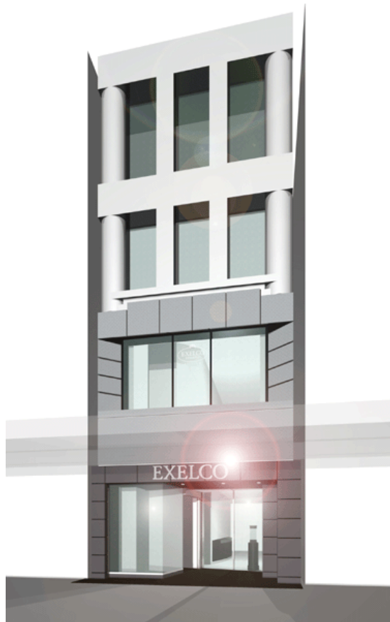
※写真は店舗イメージ