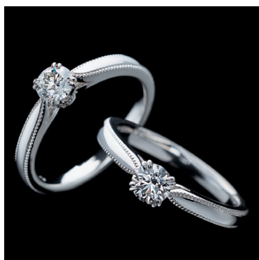
<ダイヤモンド・エンゲージリング>

3. マリッジリング成約者全員にオリジナル「ローズリングクッション」をプレゼント