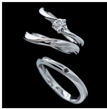
<エンゲージリング&マリッジリング>