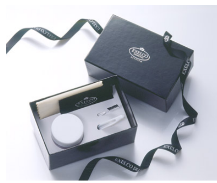
<ジュエリークリーナーキット BOX>