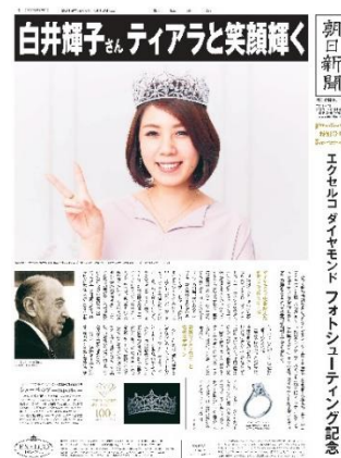
<パーソナル新聞イメージ>