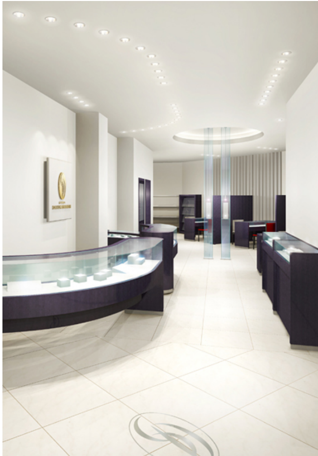
※店舗の内観イメージ