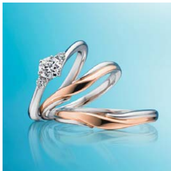
<セットリング「AIGLE(アイグレイ)」>

25日(土)、26日(日)のオープニングデイにご予約されたお客様には、 素敵なプレゼント をご用意しています。