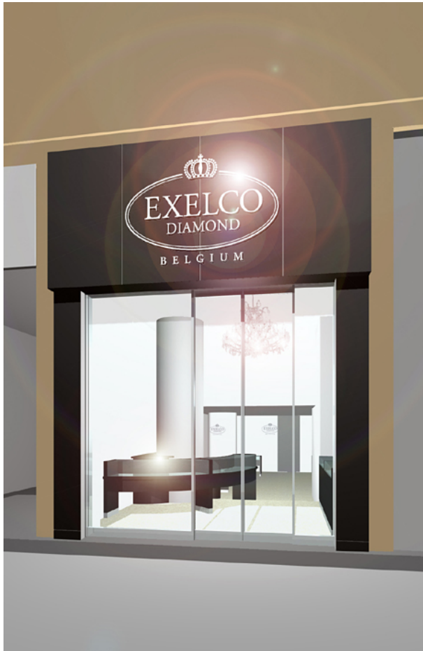
※店舗の外観イメージ