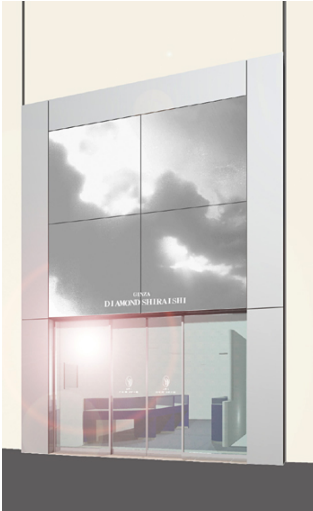
※店舗の外観イメージ