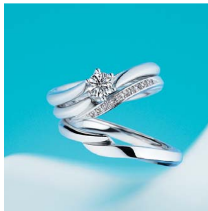
<セットリング「アクア ニーナ」>