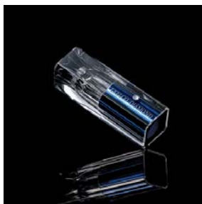
<オリジナル スコープ>