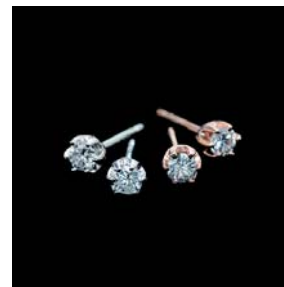
<ダイヤモンド プチピラス>