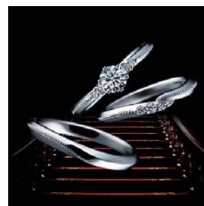
<エンゲージリング・マリッジリング>