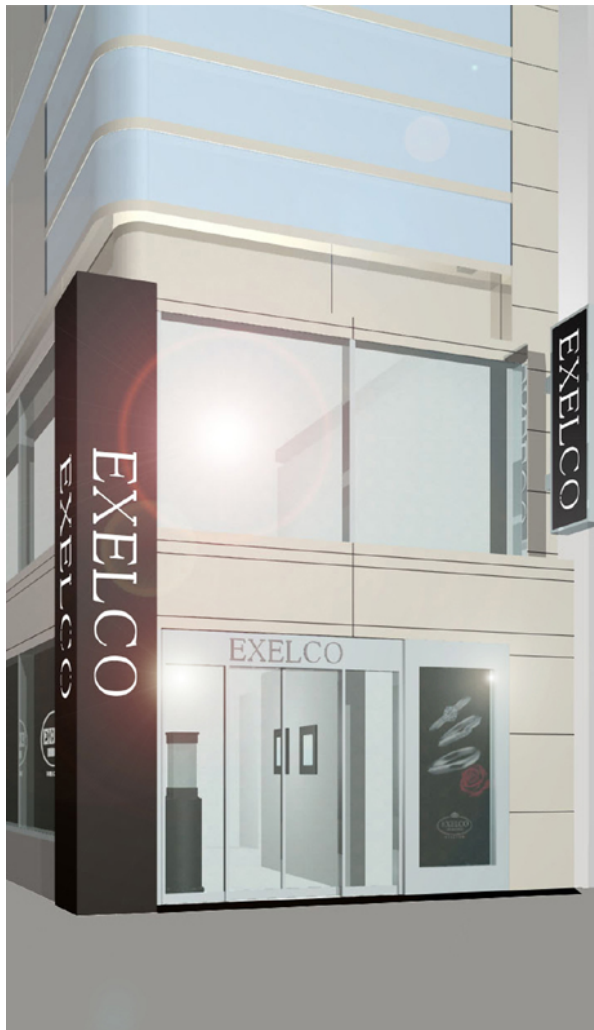
※店舗の外観イメージ