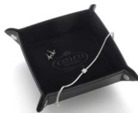
<エクセルコ オリジナル アイテム イメージ>