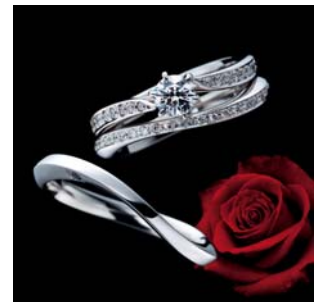
<エンゲージリング・マリッジリング>