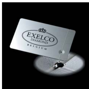
<ブラックダイヤモンドプレート>