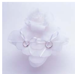
<ローズリングクッション>