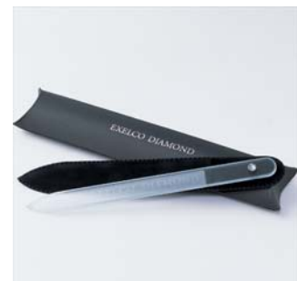
<オリジナルネイルファイル(爪やすり)>