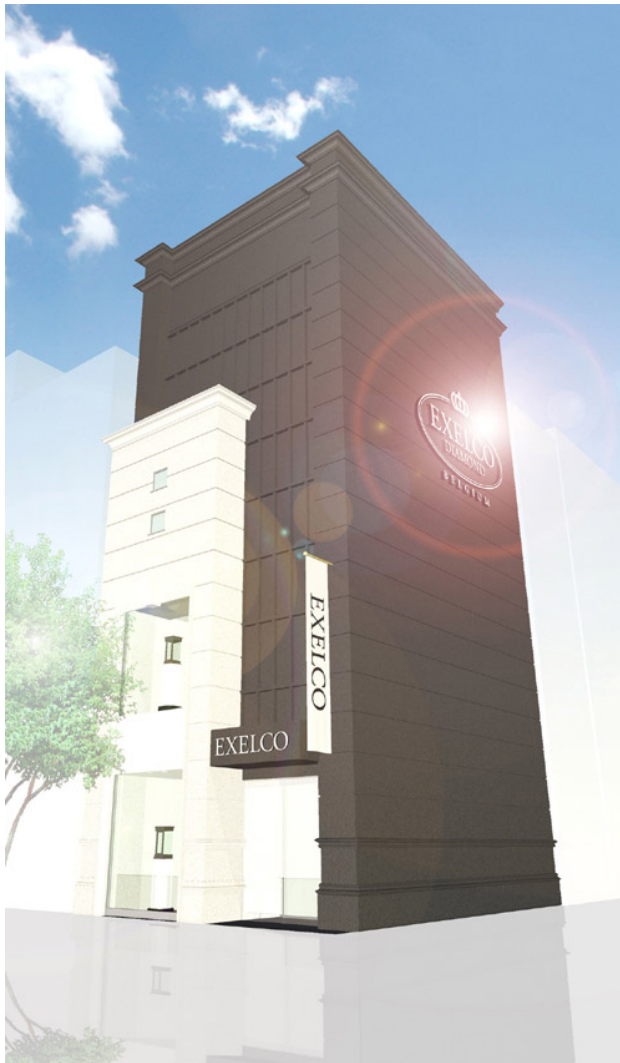
※ブランドロゴがひととき目立つインパクトのあるファサード