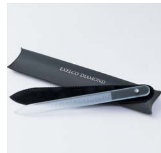
<オリジナルネイルファイル(爪やすり)>