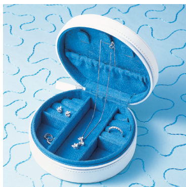
<ジュエリーボックス>