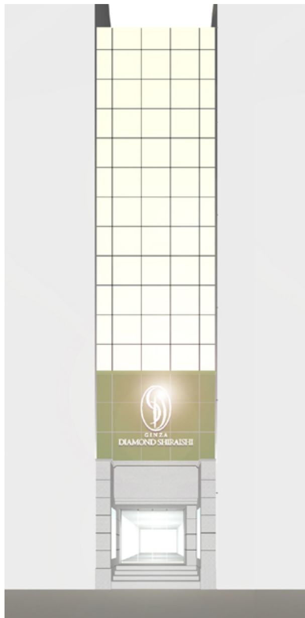
※店舗の外観イメージ