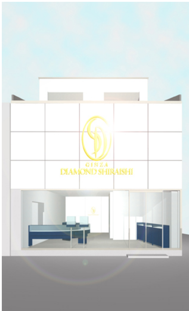
※店舗の外観イメージ