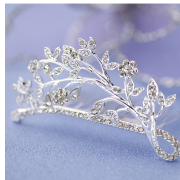
<プリンセスフラワーコーム>