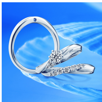
<新作セットリング「ヴィーナス」>