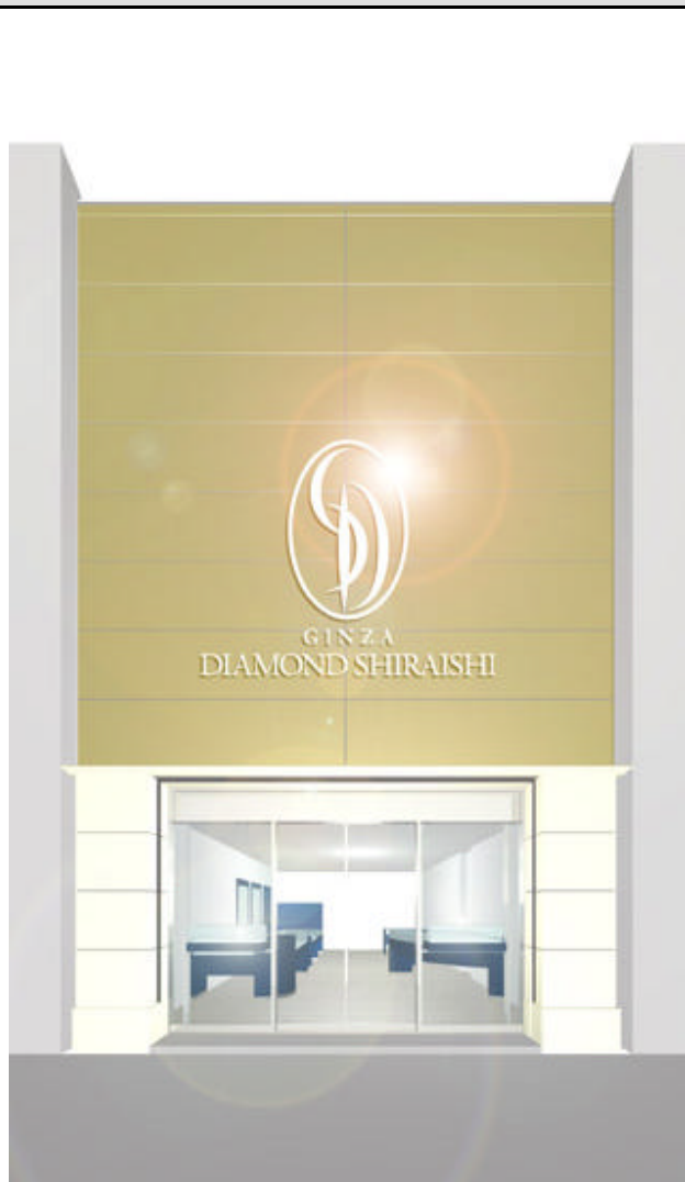
店舗の外観イメージ