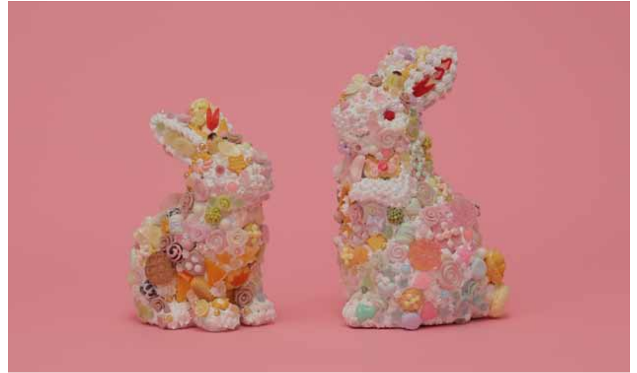
Sanctuary-rabbit- 左 h18xw14xd110cm 右 h21xw14xd10cm