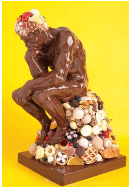
Im thinking h52xw27xd27cm